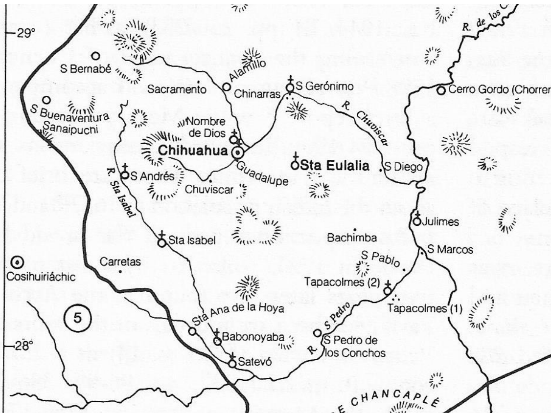
Map of San Andres and San Bernabe and its proximity to the Villa de Chihuahua, Nueva Vizcaya (The North Frontier of New Spain, Peter Gerhard, page 196)

This census is a household-by-household type. The households are unnumbered, the ages are recorded, and surnames are consistently recorded for most of the first half of the censuses. The racial classification is not listed in the person by person listing, but the end tabulations do provide a numerical breakdown on the racial classifications. Towards the end of the census, many of the surnames are not recorded and the ages are also not recorded. Only sparingly are occupations recorded. The census taker did not note where residents originated from, i.e. were they natives of the area, elsewhere in Nueva Vizcaya, or beyond Nueva Vizcaya.